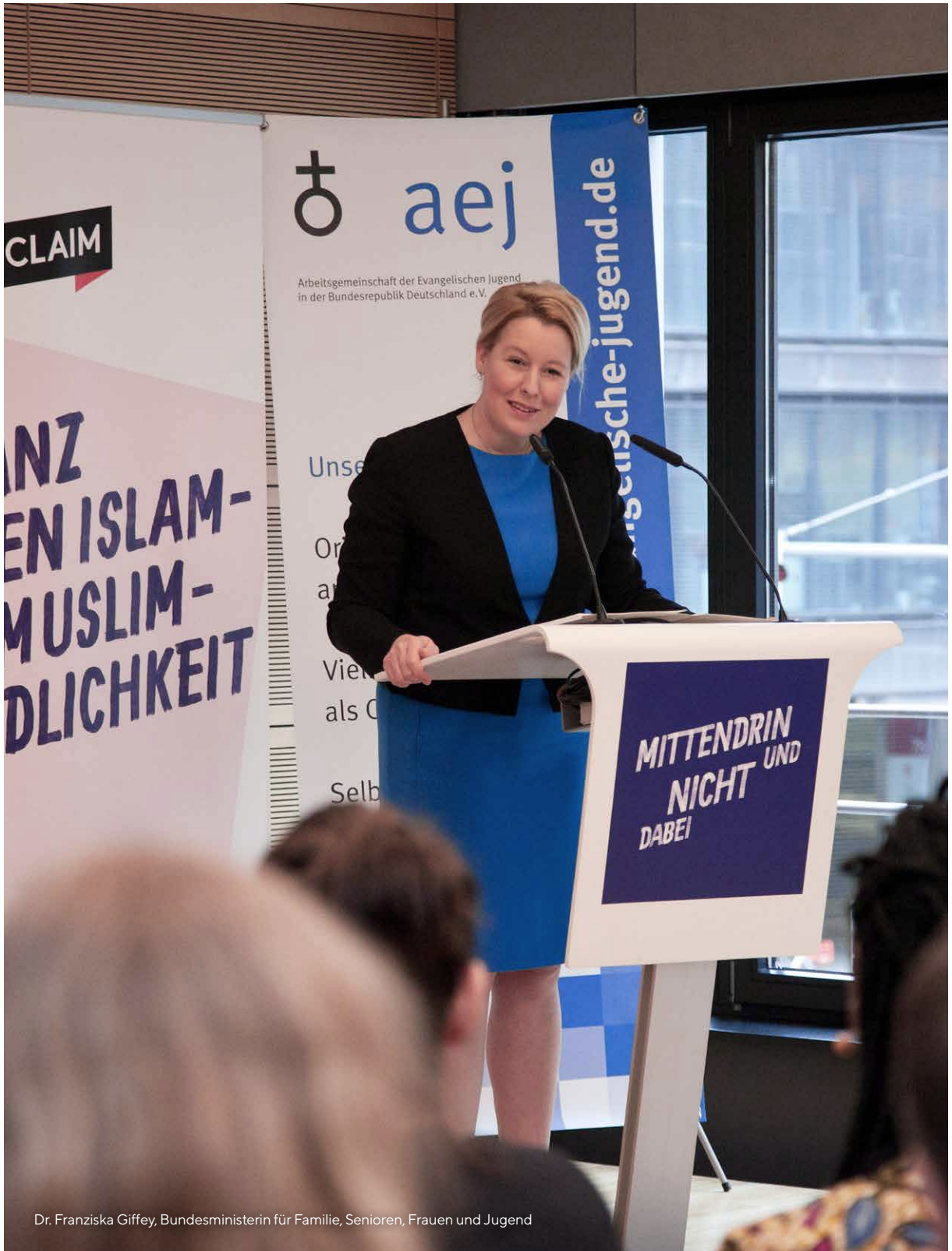
Dr. Franziska Giffey, Bundesministerin für Familie, Senioren, Frauen und Jugend